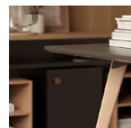
Cantos redondos e rampeados Rounded and angled corners Esquinas redondeadas y en ángulo Coins arrondis et inclinées