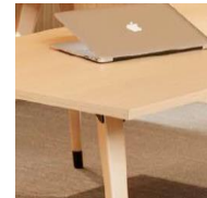
Cantos a 90° 90° Corners Esquinas de 90° Coins a 90°